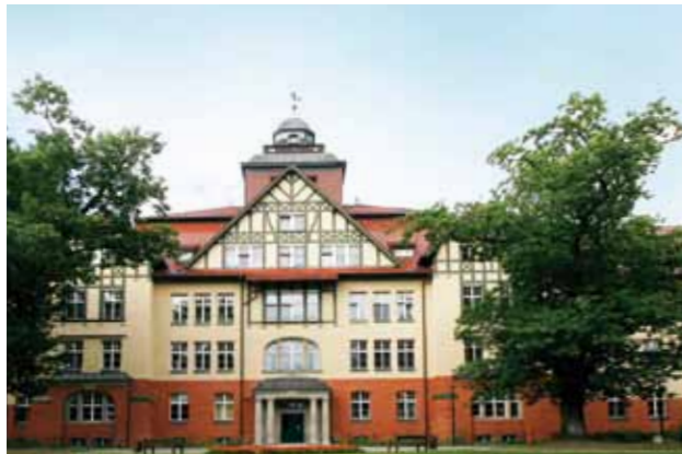
● Spezial: z. B. Klinik in Beelitz

Alle Immobilien werden professionell und profitabel bewirtschaftet. In Berlin befinden sich die größten Bestände. Als Landesunternehmen setzen wir uns nachhaltig für die Berliner Mieter ein.