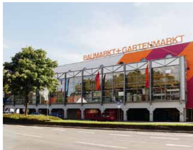
● Handel: z. B. Bau- und Gartenmarkt in Bielefeld