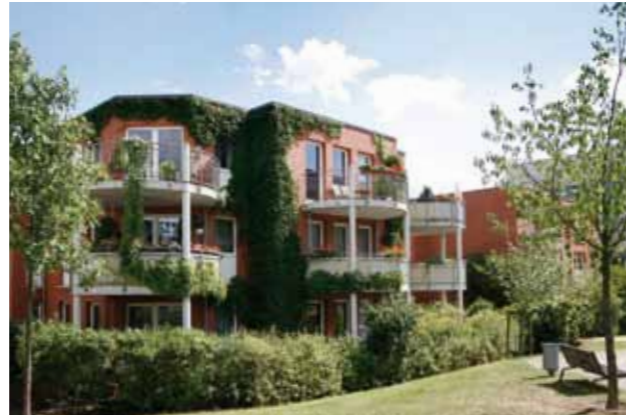
● Wohnen: z. B. Wohnanlage Landsberger Tor in Berlin