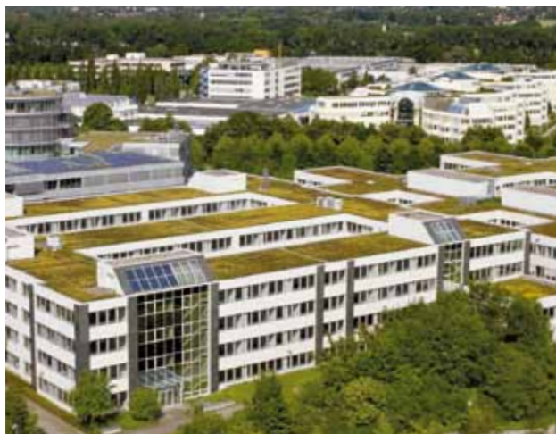
● Büro: z. B. Bürohaus in München-Dornach