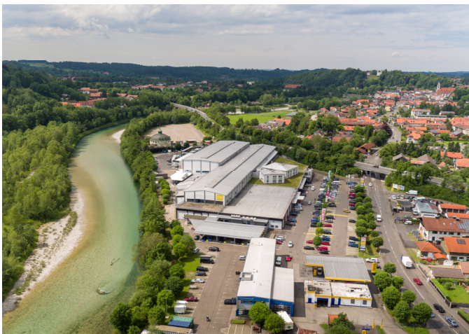
Vogelperspektive Einkaufszentrum Moraltpark