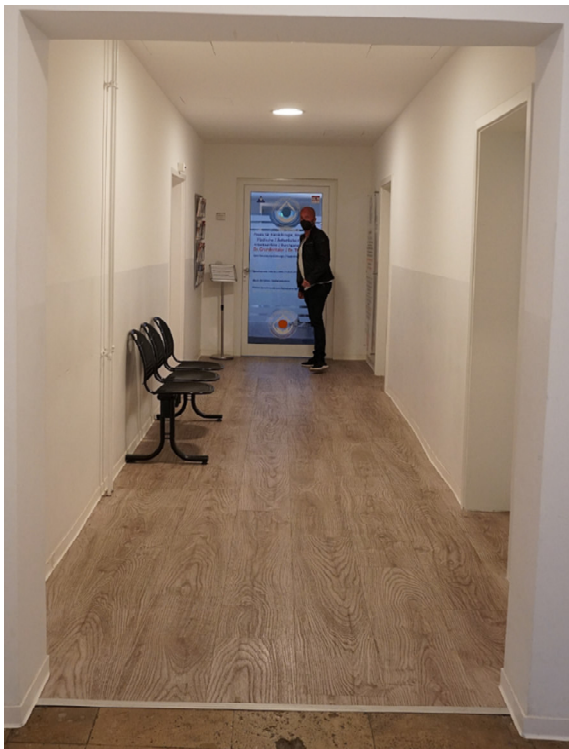
Flur im Haus 19 Musterfoto