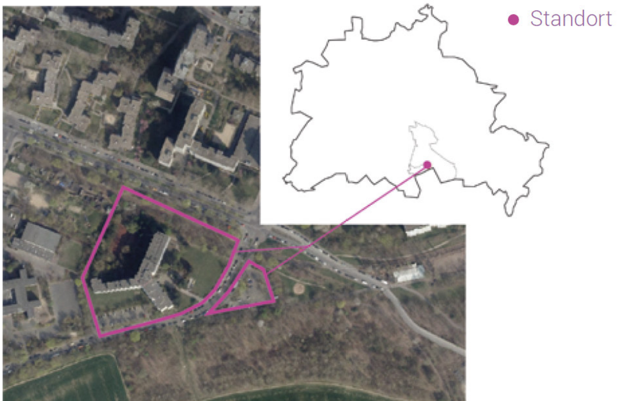
Abbildung 2: Großräumliche Einordnung der Grundstücke Ringslebenstraße 1 und 2

Die Grundstücke liegen im Bezirk Neukölln, im Ortsteil Gropiusstadt. Gropiusstadt liegt am südöstlichen Rand Neuköllns an der Grenze zu Brandenburg. Die Bebauung des Umfeldes besteht weitgehend aus Einfamilienhäusern. In den 70er Jahren entstanden zudem Großwohnsiedlung, vor allem entlang der Ringslebenstraße und der Lipschitzallee. In unmittelbarer Nähe befindet sich das Vogelschutzgebiet am Wildmeisterdamm, sowie der Freizeitpark am Vogelwäldchen. Auch der im Bundesland Brandenburg liegende Sky-Point kann fußläufig erreicht werden. Als weitere Grün- und Freizeitfläche kann der Britzer Garten aufgeführt werden, der von der Ringslebenstraße 2 aus innerhalb von 30 Minuten fußläufig erreicht werden kann.