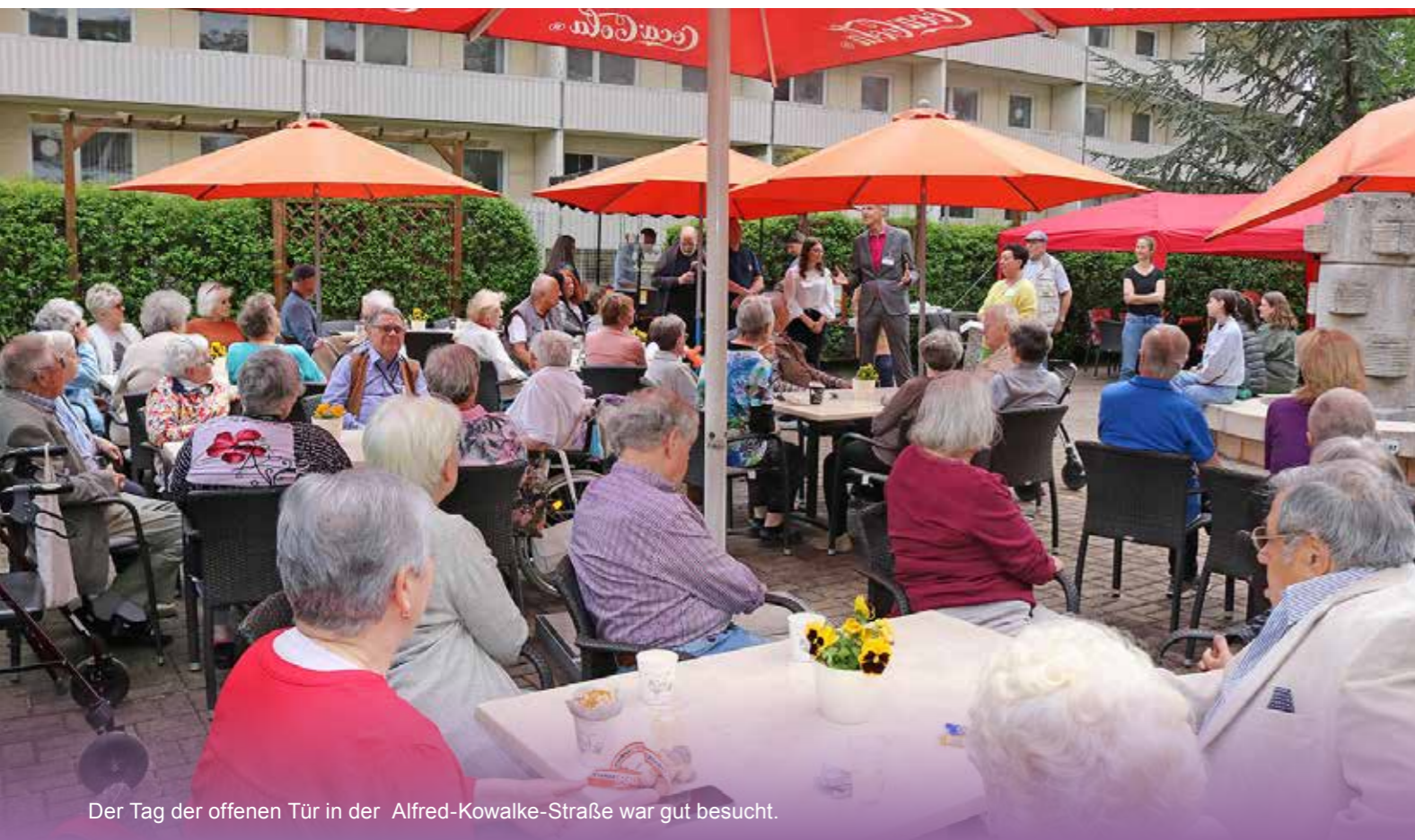
Der Tag der offenen Tür in der Alfred-Kowalke-Straße war gut besucht.

Im Rahmen von „Heimaten bei berlinovo “ unterstützt berlinovo das soziale Projekt in Zusammenarbeit mit der Volkssolidarität. Im Wohnquartier