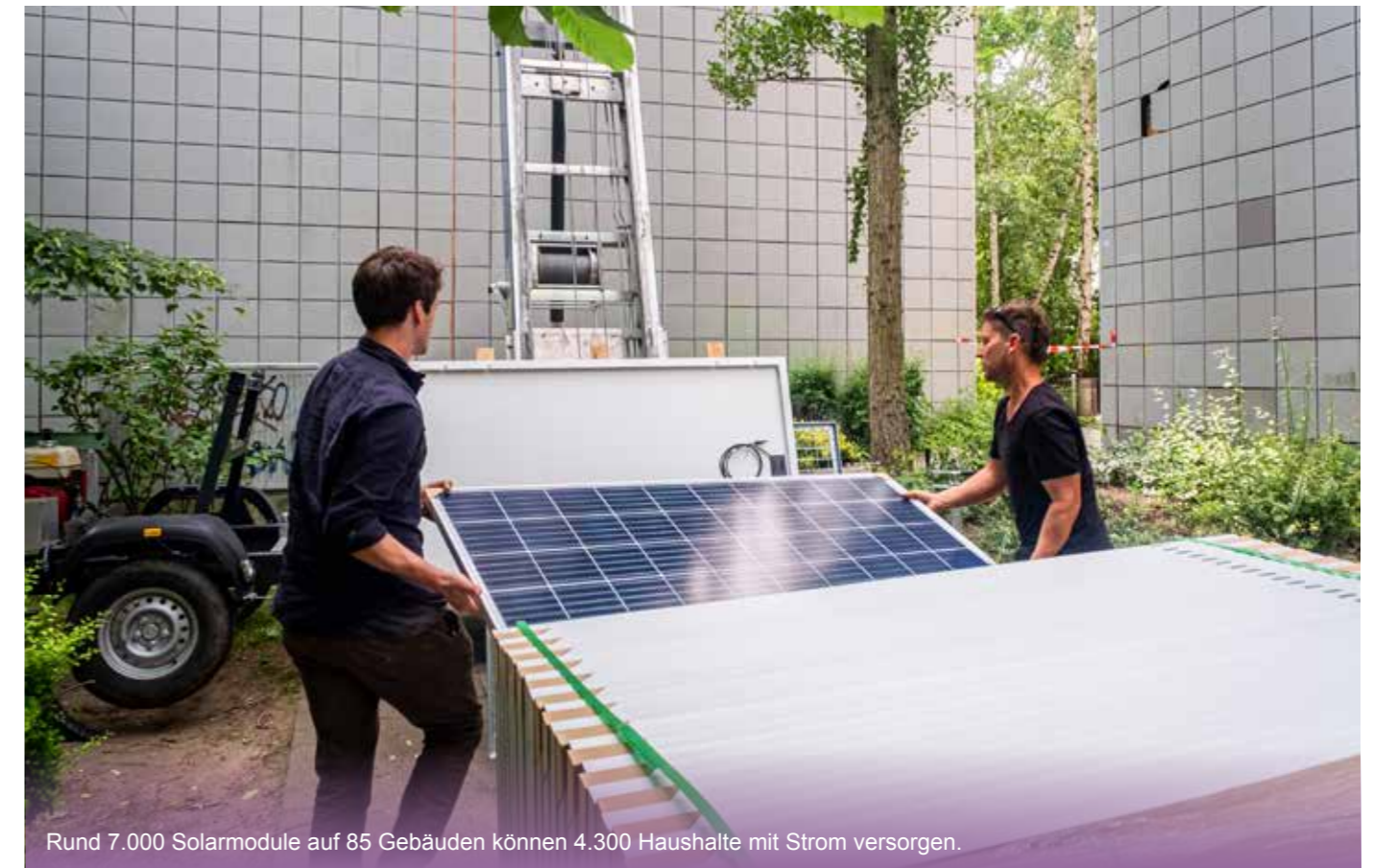
Rund 7.000 Solarmodule auf 85 Gebäuden können 4.300 Haushalte mit Strom versorgen.

*Von der Energiepreisgarantie ausgenommen sind gesetzlich festgelegte Steuern, Abgaben und sonstige hoheitlich auferlegte Belastungen, wie Umlagen und Netzentgelte sowie Preisänderungen für künftig wirksam werdende neue Steuern, Abgaben und sonstige hoheitlich auferlegte Belastungen.