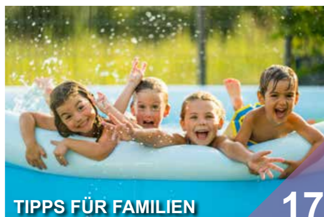
TIPPS FÜR FAMILIEN